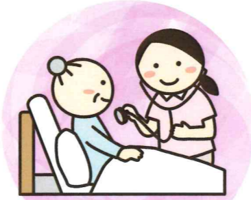
健康状態の観察・相談