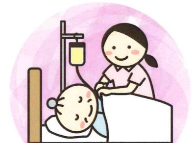
医療器具装置の看護