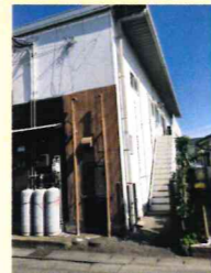
裏の階段を上ったら入口