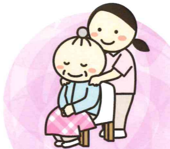
認知症、終末期の看護