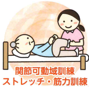
関節可動域訓練 ストレッチ・筋力訓練

訪問リハビリはリハビリの必要性があるのに通院が困難な方に対して、理学療法士（PT）・作業療法士（OT）・言語聴覚士（ST）が直接お伺いして自宅で行うリハビリテーションです。具体的にはそれぞれの状態に合わせて次のようなことを行います。