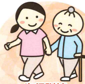
歩行訓練 介助方法指導