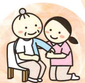
日常生活動作訓練